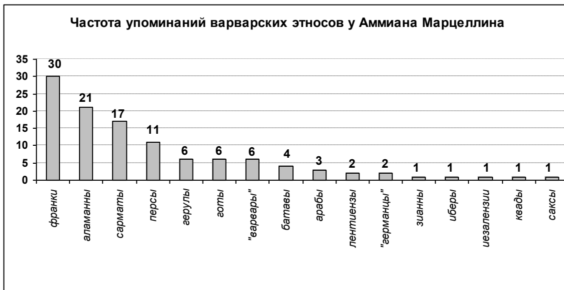
Рис. 1. Количество упоминаний в «Деяниях» варварских народов, представители которых находились (или планировали находиться) на римской военной службе.

В итоговой табл. 2 представлено распределение упоминаний Аммиана Марцеллина о присутствии в римской армии варварских контингентов по всем 18 сохранившимся книгам «Деяний» (XIV–XXXI). Для большей наглядности заполненные числовыми данными ячейки выделены светло-серым фоном; в итоговых строке и столбце затемнены самые высокие значения (превышающие показатель, равный 10).